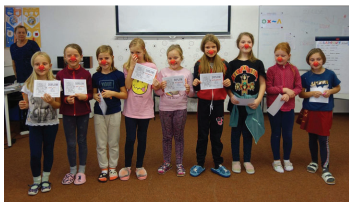
Třetíci v Mladoňově soutěžili