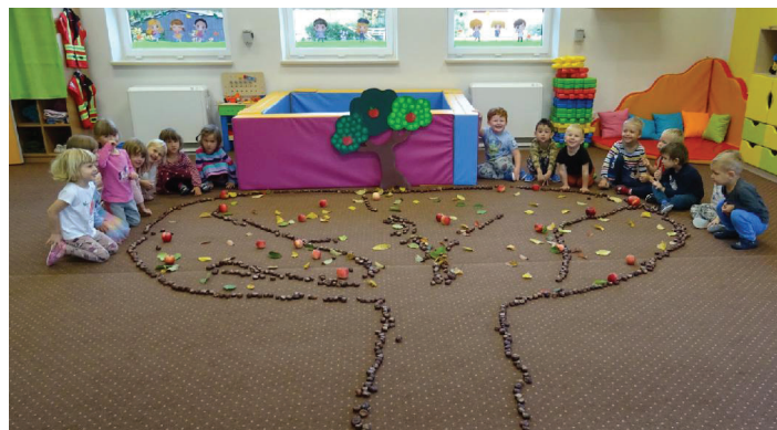
Ke hraní využíváme i přírodní materiál. Takto jsme si vytvořili jablko.