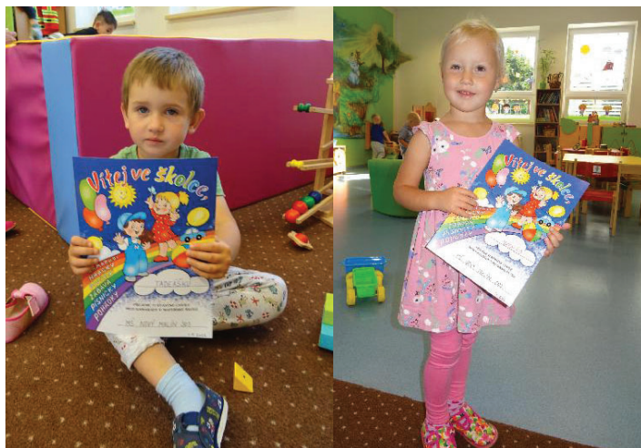
1. září jsme ve třídě nejmenších přivítali nové děti.