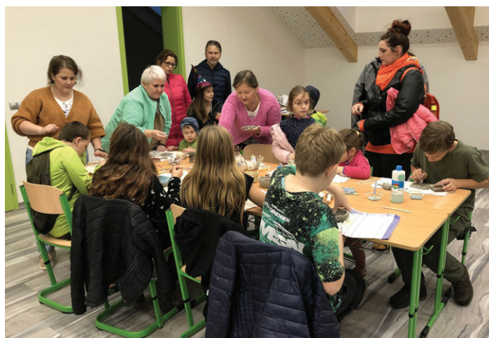
Hodiny otevřených dveří