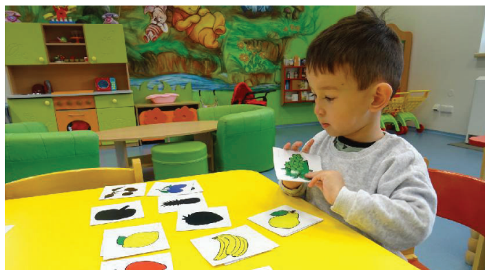
Skládáme, třídíme, navlékáme, montujeme a konstruujeme a ani nevíme, že se učíme.