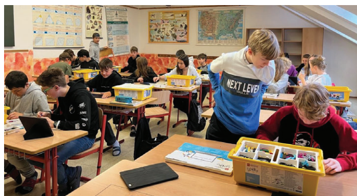
Výuka programování s Lego stavebnicemi