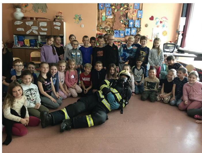
Beseda s hasičem v družině