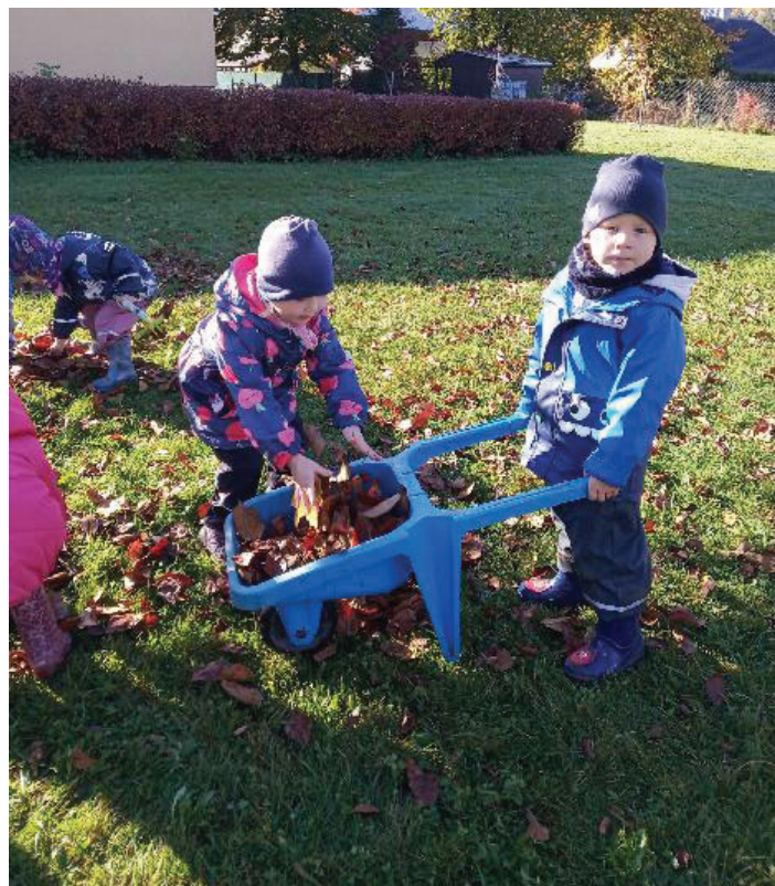
Na zahradě si nejen hrajeme, ale také pomáháme. Posbírali jsme ořechy, hrabali jsme listy a odváželi je na kompost.