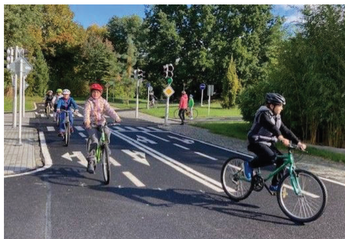
Na dopravním hřišti