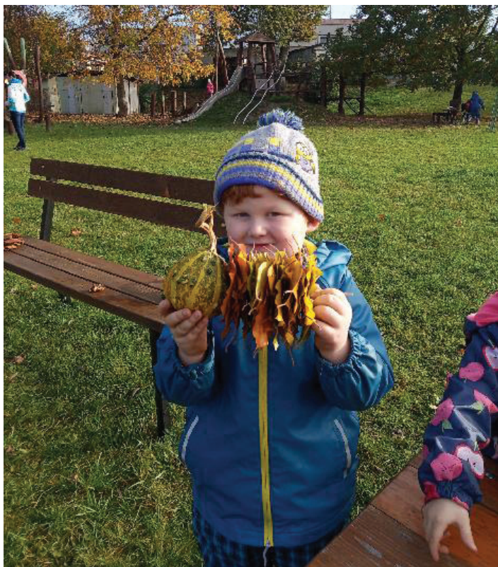
S přírodninami si hrajeme i venku. Děti vyrobily housenky z listů a malých dýní.