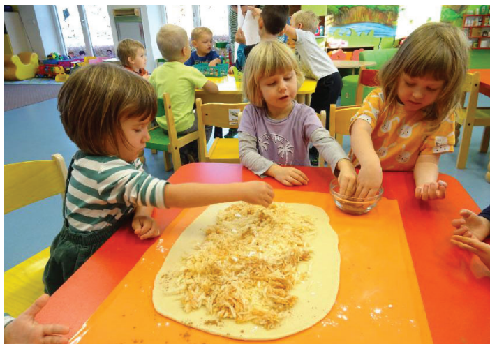
Také jsme si připravili, upekli i snědli výborný štrúdl.