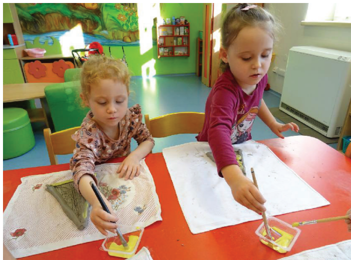
Poprvé jsme si vyzkoušeli pracovat s keramickou hlinou.