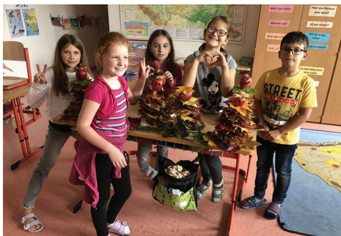
Výuka programování s Lego stavebnicemi