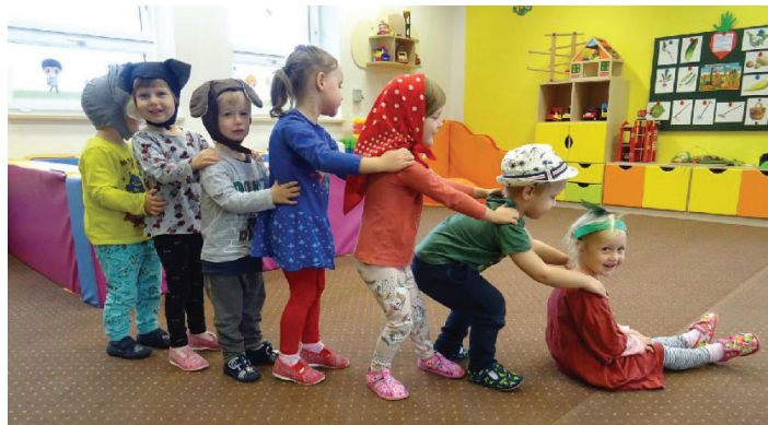
Moc rádi posloucháme pohádky a hrajeme divadlo.