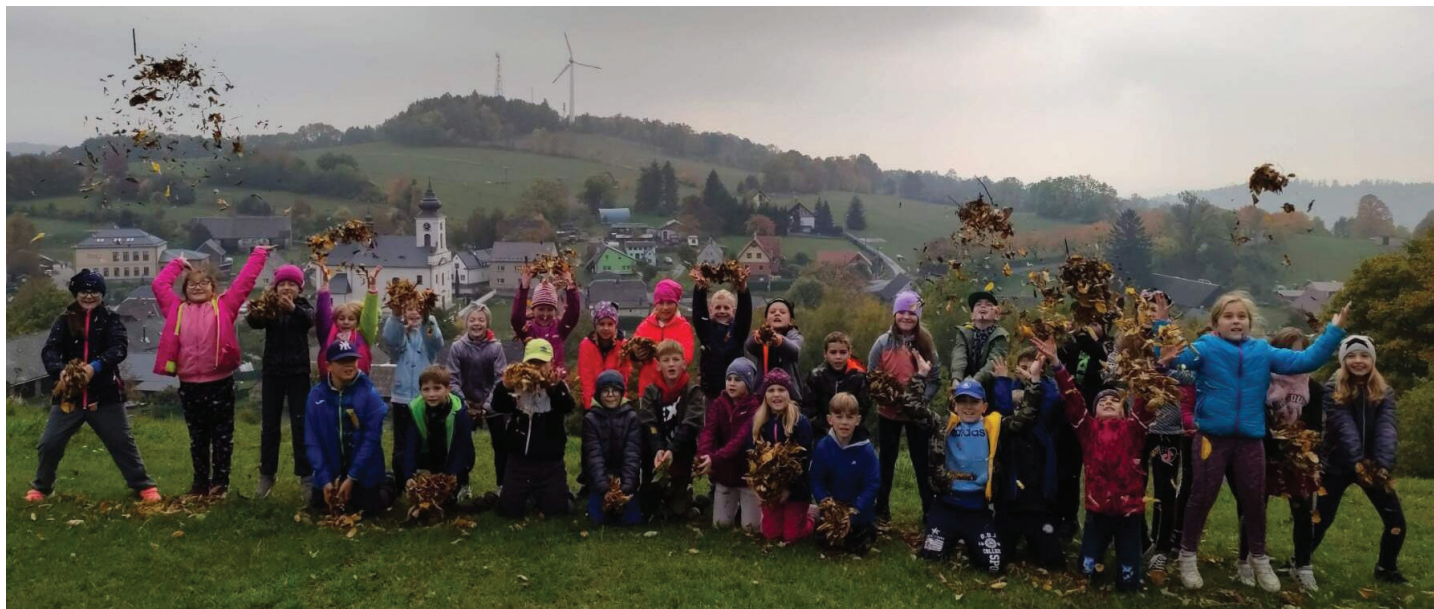
Třebáci nad Mladoňovem