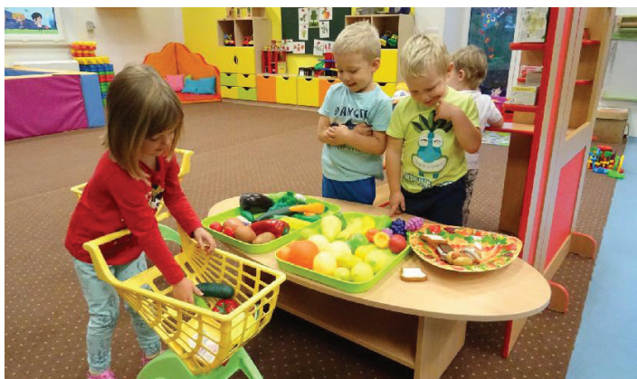
Ve školce máme veselo. Je tu spousta hraček a kamarádů.