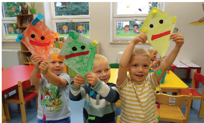
Rádi si malujeme, kreslíme a tvoříme. Učíme se držet štětec, pastelky, lepit a stříhat nůžkami.